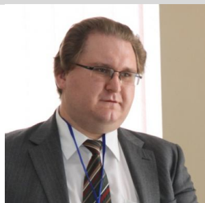
Тарас Качка Вице-президент Американской торговой палаты, специалист по международному праву, член делегации Украины в переговорах с ЕС по Соглашению об ассоциации между Украиной и ЕС.